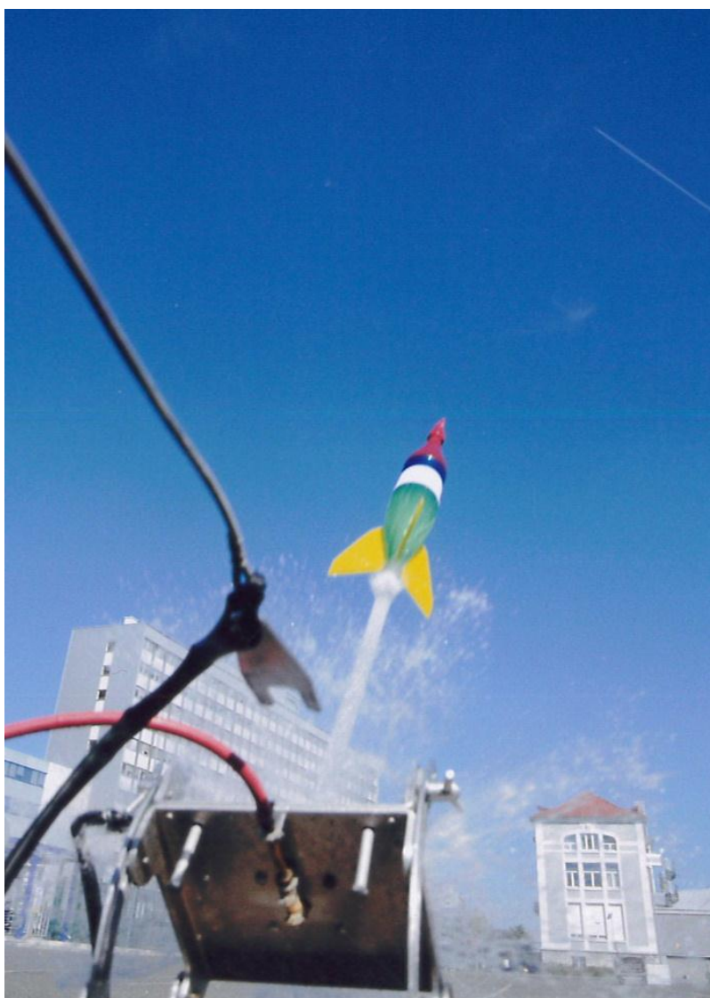
Environ 45 ms après décollage.

Document pédagogique pour les enseignants de Collège (3 ème )